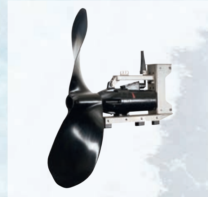
MD(X) 52™ Strömungsbeschleuniger im Leistungsbereich 1,5 – 4 kW