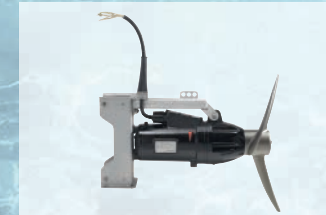
Schlammrührwerk mit Tauchmotor und Getriebe im Leistungsbereich von 1,5 – 18,5 kW

Schlammrührwerke mit Tauchmotor, flexibel im Einsatz! Eine grosse Palette von Befestigungsvarianten ermöglicht den Einsatz in den verschiedensten Beckenformen. Ohne Grenzen. Flüssigkeiten homogenisieren, Bodenschlamm verhindern, Schwimmdecken auflösen oder das Eintragen von Zusätzen: Arnold bietet eine massgeschneiderte, flexible Lösung an.