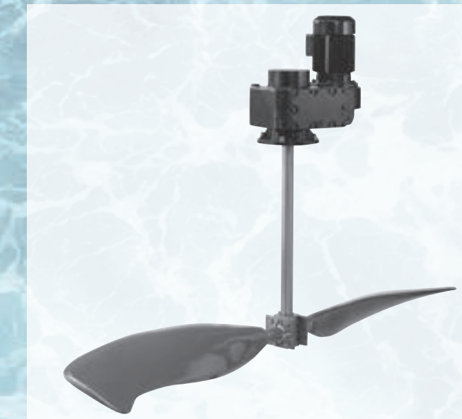
Vertikalrührwerk Eco-Rex™ für den Einsatz in Denitrifikations-Becken

Dauerhafte Lösungen mit flexiblen Trennwänden. Effizienzsteigerung pur dank der Kombination von Vertikalrührwerken mit flexiblen Trennwänden.