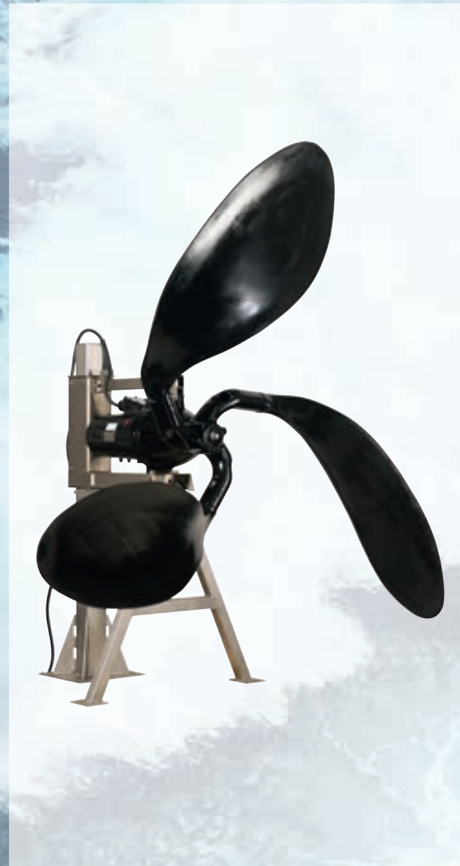
Strömungsbeschleuniger 162™ mit Propellerdurchmesser von 2,30 m

Die Zuverlässigkeit der Arnold-Produkte ist kein Zufall: Qualität ist unsere Maxime. Optimaler Materialeinsatz verhindert galvanische Korrosion. Im Prüfstand werden die Produkte unter dynamischen Bedingungen getestet: schonungslos. Dazu stehen wir.