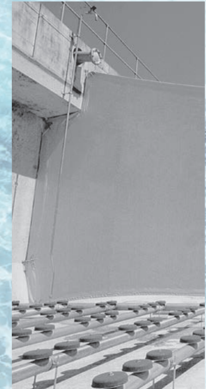
Bild rechts: Eine von 24 flexiblen Trennwänden in der Kläranlage Werdhölzli, Zürich mit einer Fläche von 54 m 2

Dauerhafte Lösungen mit flexiblen Trennwänden. Effizienzsteigerung pur dank der Kombination von Vertikalrührwerken mit flexiblen Trennwänden.